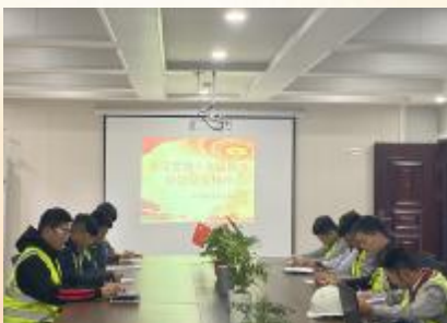
浦江项目部组织全体党员学习全会精神