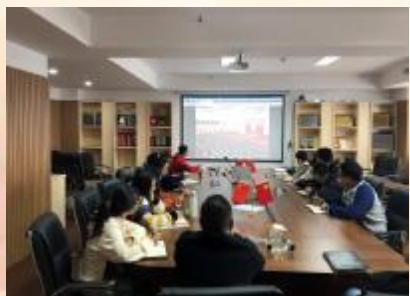
第三分公司观看学习全会精神视频报道

对全会精神的理解,纷纷表示将以党建为引领,坚持把支部建在项目上,继续发挥党员模范带头作用,做好项目质量控制;坚持改革创新、与时俱进,充分运用互联网、BIM技术,为项目创优夺杯积蓄动能。