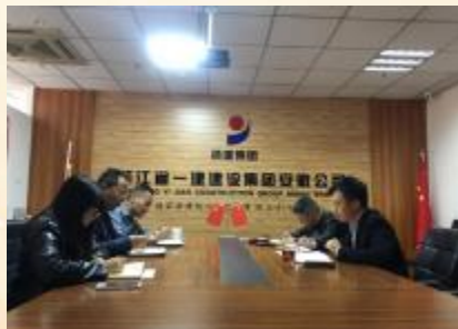
安徽分公司党支部组织开展专题学习会