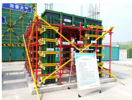
了社会和业内广泛关注和好评。

日前,在杭州大江东义蓬安置小区工程现场,共计一千余相关人员来到杭州市大江东义蓬安置房项目,感受这所“工地模范学校”在文明施工和扬尘防治的优秀做法。